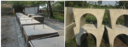
Construcción de Silletas para la industria petrolera