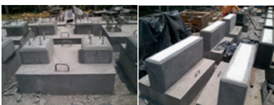
Fabricación de Soportes en Concreto para la industria petrolera

Nuestra empresa está en capacidad de fabricar SOPORTES Y CAJAS EN CONCRETO, así como también, LASTRAR TUBERÍA Y SILLETAS IN SITU o en patio en cualquier parte del territorio colombiano. Contamos con una planta de concreto que facilita la realización de este trabajo, al igual que con personal altamente calificado para desempeñar de la manera más óptima nuestros productos.