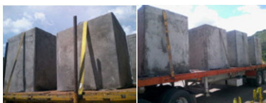
Fabricación de Cajas en Concreto para la industria petrolera